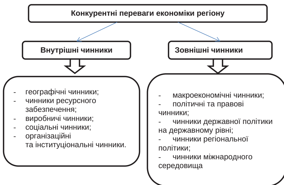
Рис. 1. Класифікація чинників, що впливають на формування конкурентних переваг регіонів