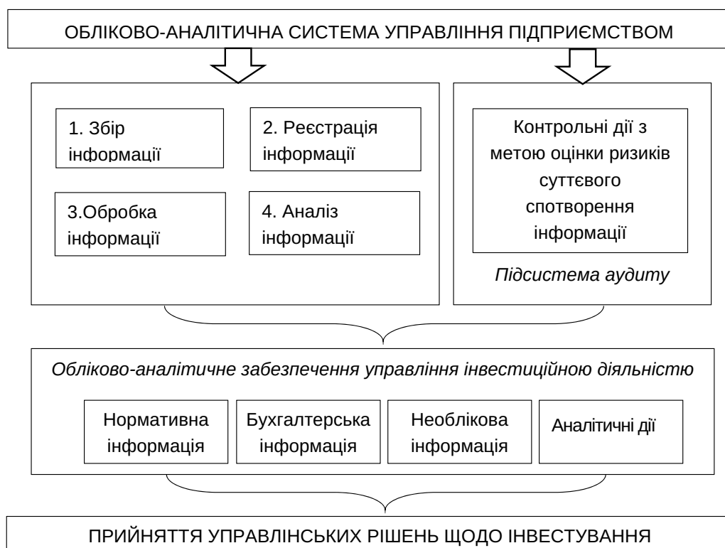
Рис. 1. Система обліково-аналітичного забезпечення процесу управління інвестиційною діяльністю підприємства