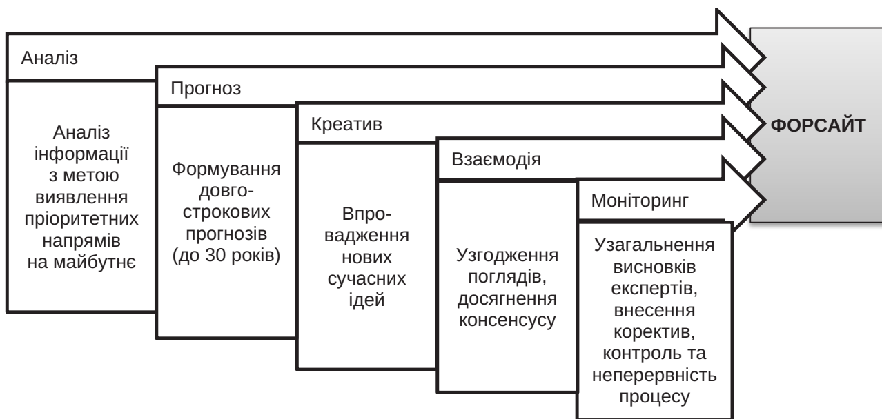
Рис. 1. Форсайт, як технологія прогнозування розвитку регіоні