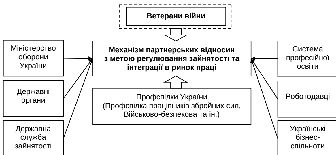
Рис. 2. Підхід до формування механізму регулювання ринку праці ветеранів війни

– державна служба зайнятості – є централізованою системою державних установ, до завдань якої належить забезпечення комплексного вирішення питань, пов'язаних з регулюванням зайнятості населення, професійною орієнтацією,