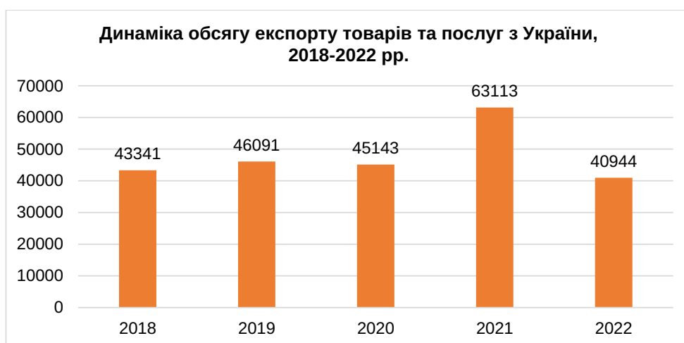
Рис. 1. Динаміка експорту товарів та послуг з України, 2018–2022 рр.