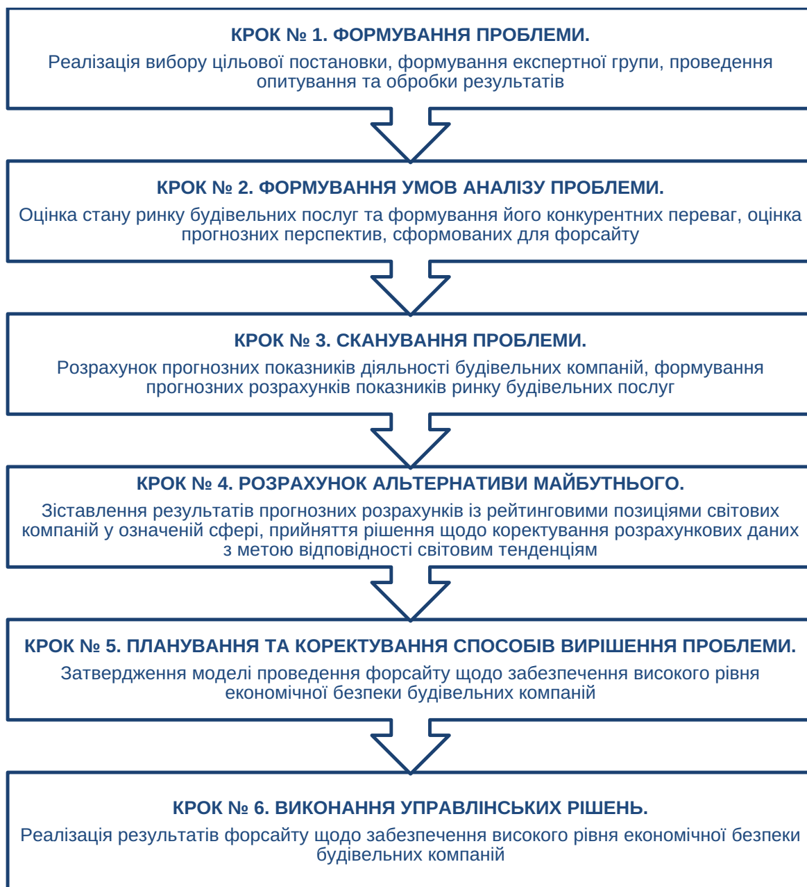
Рис. 2. Покрокова технологія проведення форсайту щодо забезпечення високого рівня економічної безпеки будівельних компаній