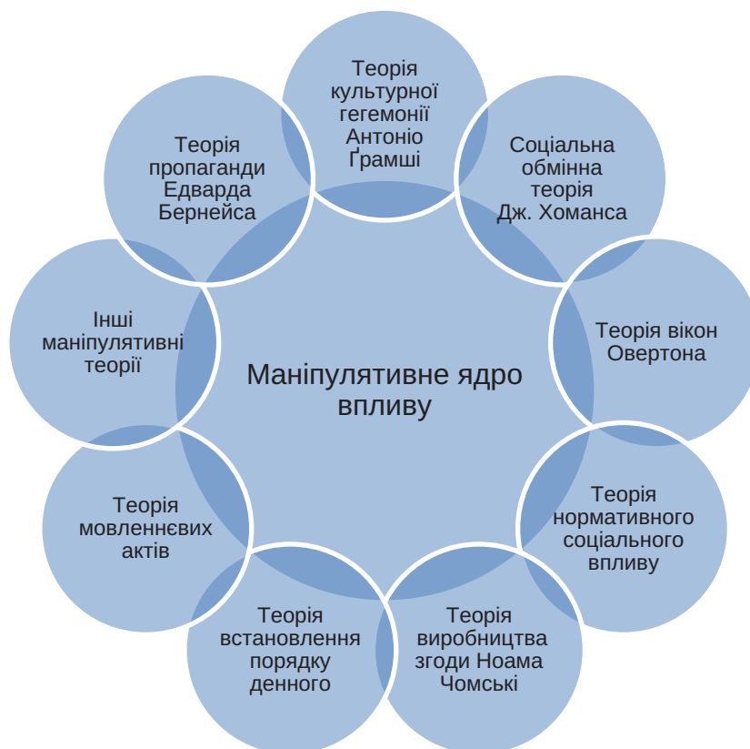
Рис. 1. Особливості формування маніпулятивного «ядра впливу»