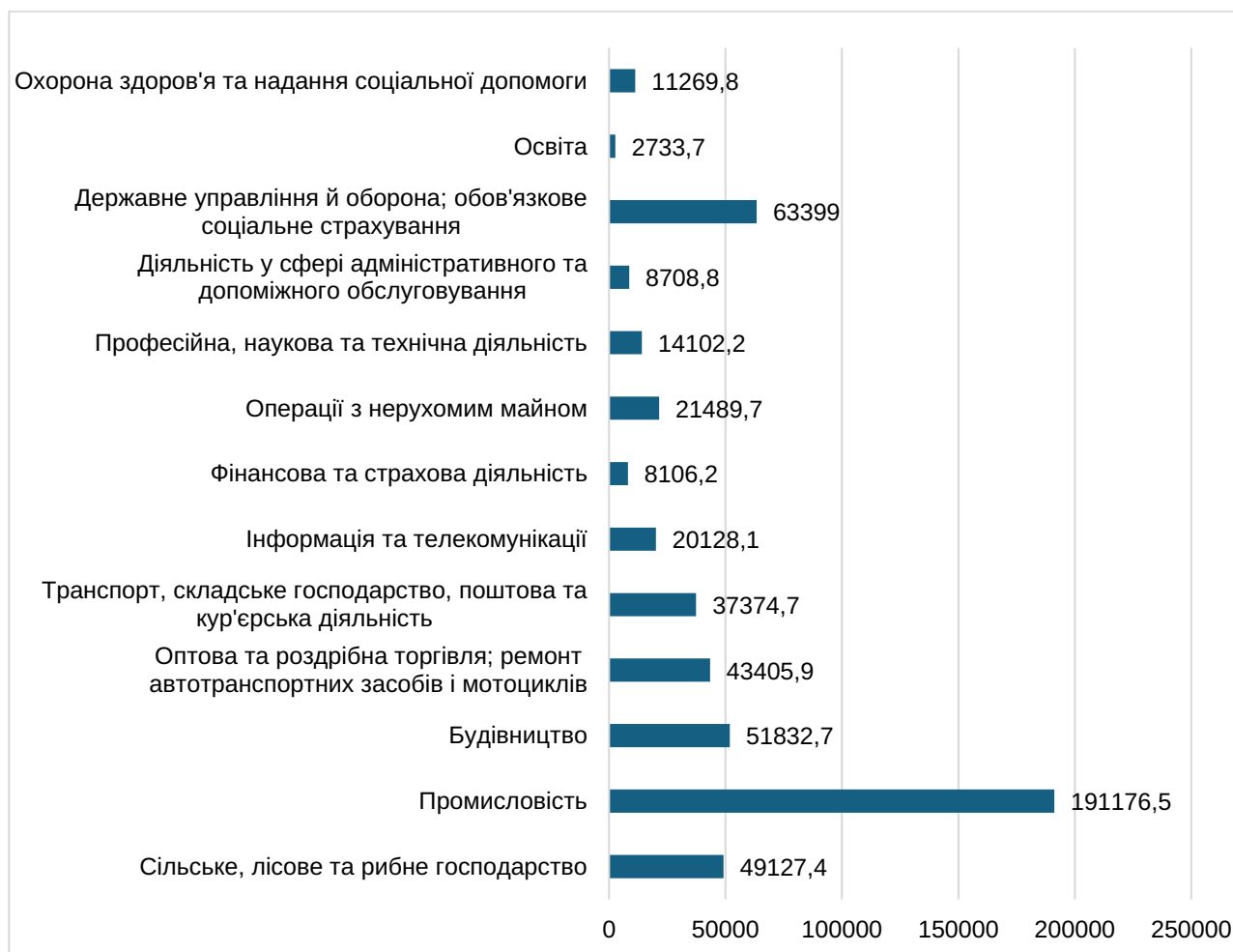
Рис. 3. Капітальні інвестиції в Україні за видами економічної діяльності, 2021 р. млн. грн.