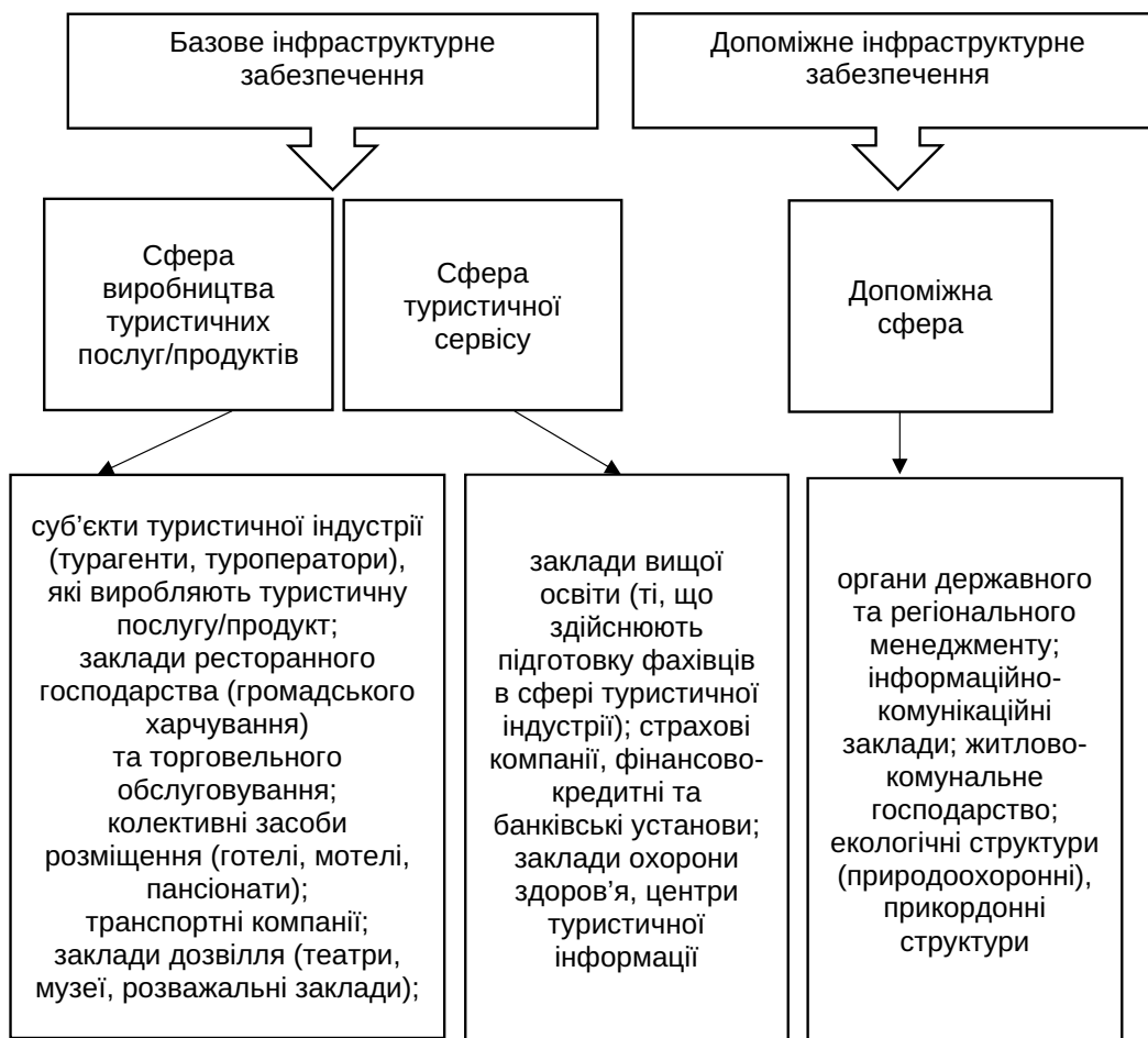
Рис. 2. Структурні елементи сфер інфраструктурного забезпечення трансформації конкурентного потенціалу суб'єктів туристичної індустрії

господарства та громадського харчування, різні формати торгівлі, типи об'єктів роздрібної торгівлі, види торговельного обслуговування, що дозволить задовольнити різні потреби споживачів, зважаючи на їх уподобання та купівельну спроможність;