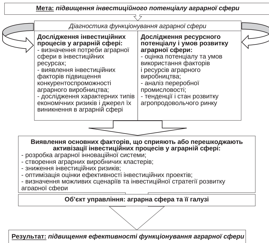
Рис. 3. Концептуальні засади економічного механізму регулювання інвестиційних процесів у аграрній сфері