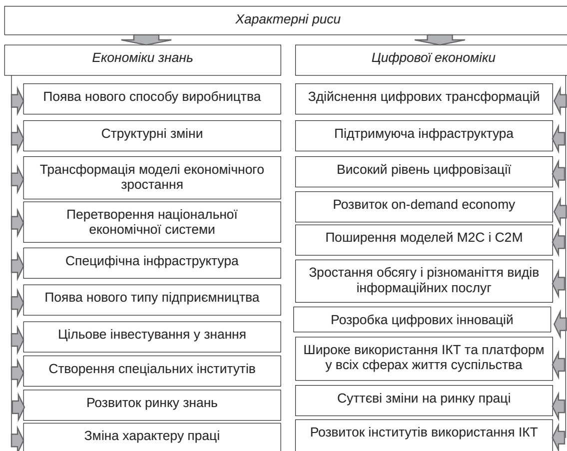
Рис. 2. Характерні риси економіки знань і цифрової економіки [1]