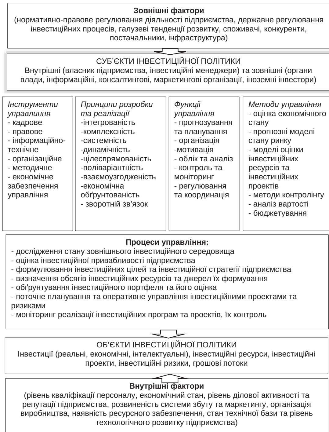
Рис. 2. Структура системи управління інвестиційною політикою підприємства та її елементи