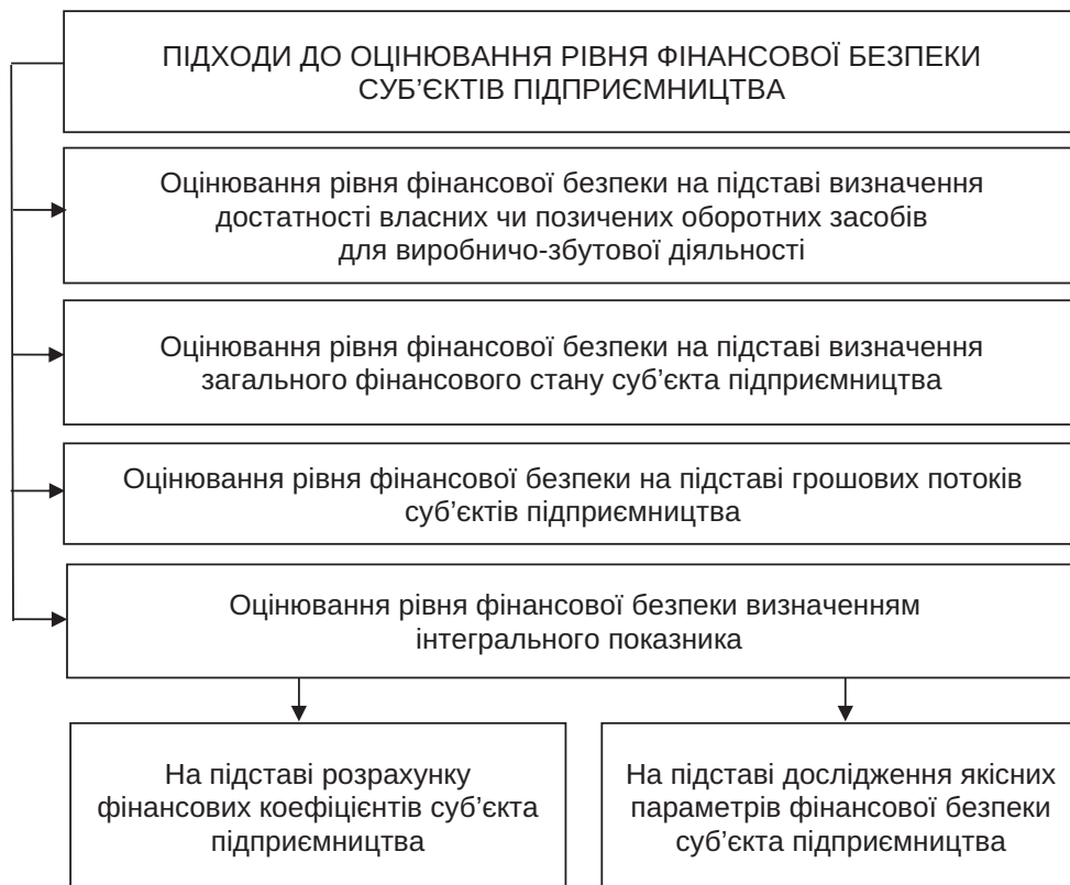
Рис. 1. Систематизація підходів до оцінювання рівня фінансової безпеки суб'єктів підприємства

Відтак, фінансову безпеку суб'єктів підприємства розглядають як складову їх економічної безпеки і окреслюють на основі визначення