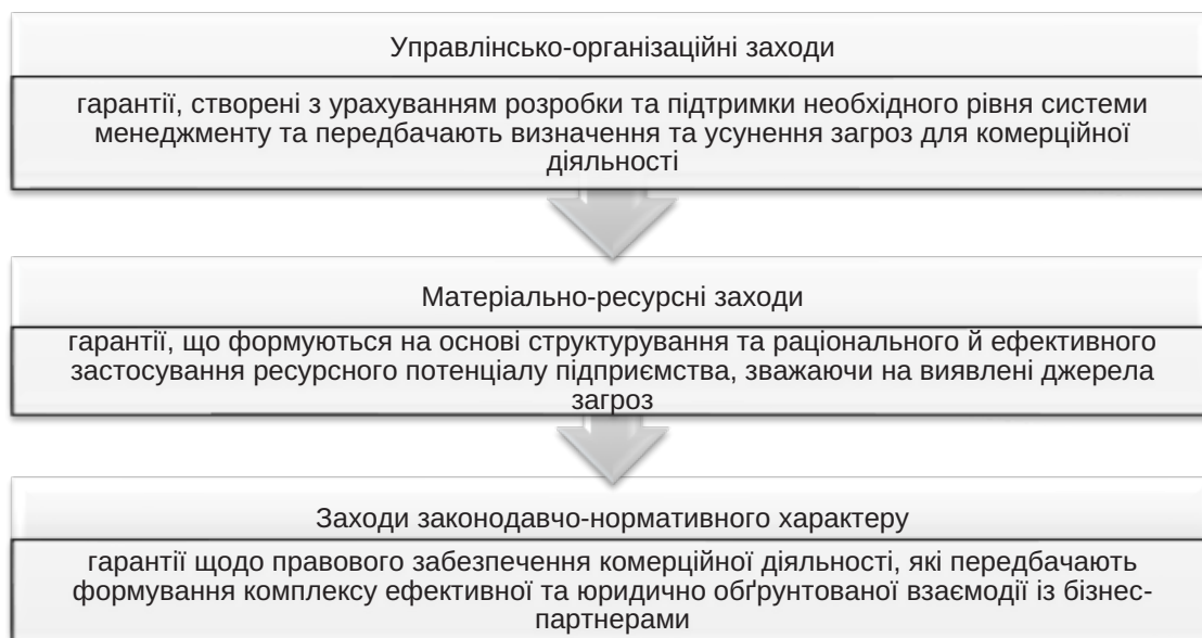
Рис. 1. Структурні елементи системи забезпечення економічної безпеки торговельного підприємства

Матеріально-ресурсні заходи – гарантії, що формуються на основі структурування та раціонального й ефективного застосування ресурсного потенціалу підприємства, зважаючи на виявлені джерела загроз